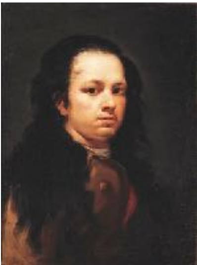
Autorretrato , Goya, 1775, Museo Goya, Zaragoza