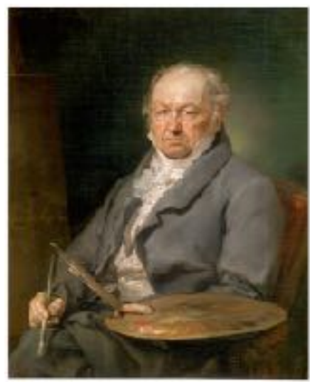
Retrato de Goya , Vicente López y Portaña, 1826, Museo del Prado, Madrid