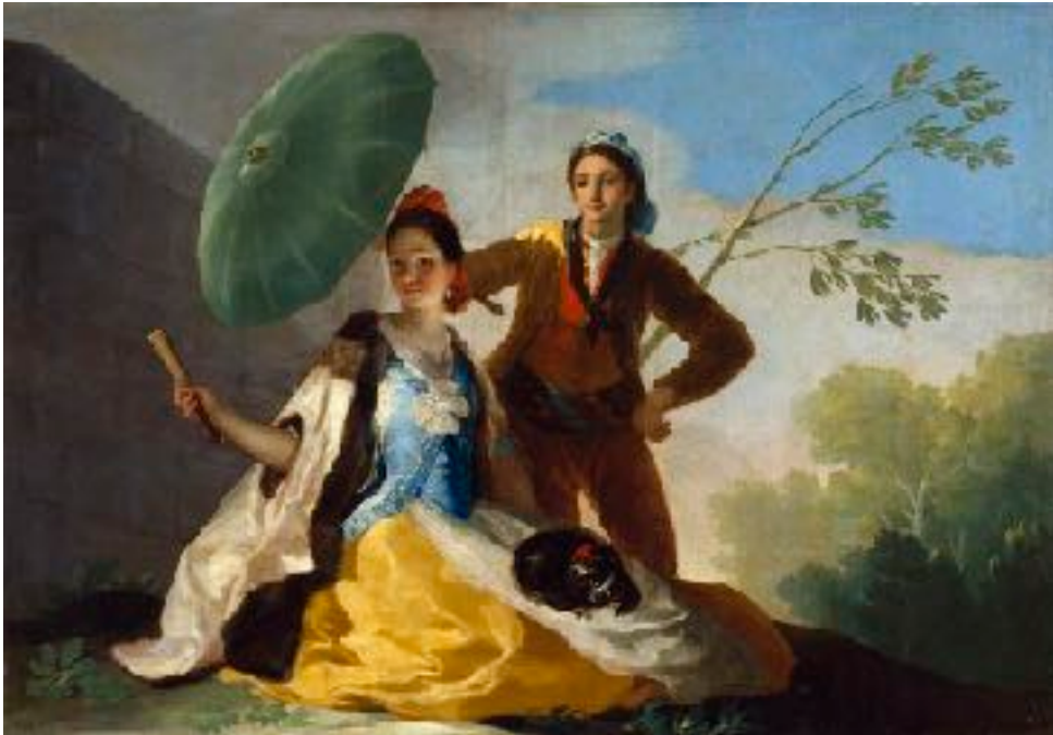
El quitasol , Goya, 1777, Museo del Prado