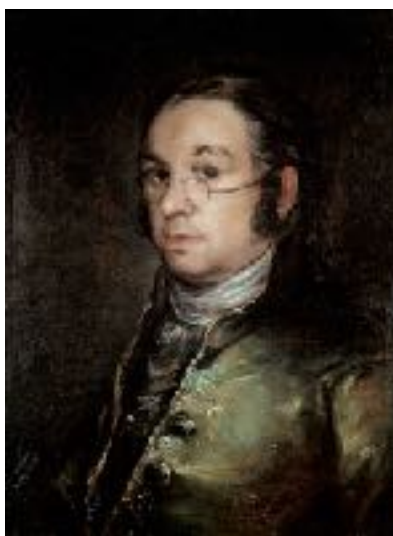
Autorretrato , Goya, 1800, Museo Goya, Castres