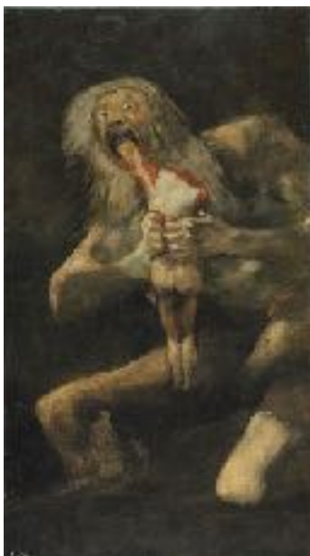
Saturno devorando a sus hijos , serie Pinturas negras , Goya, 1823, Museo del Prado, Madrid