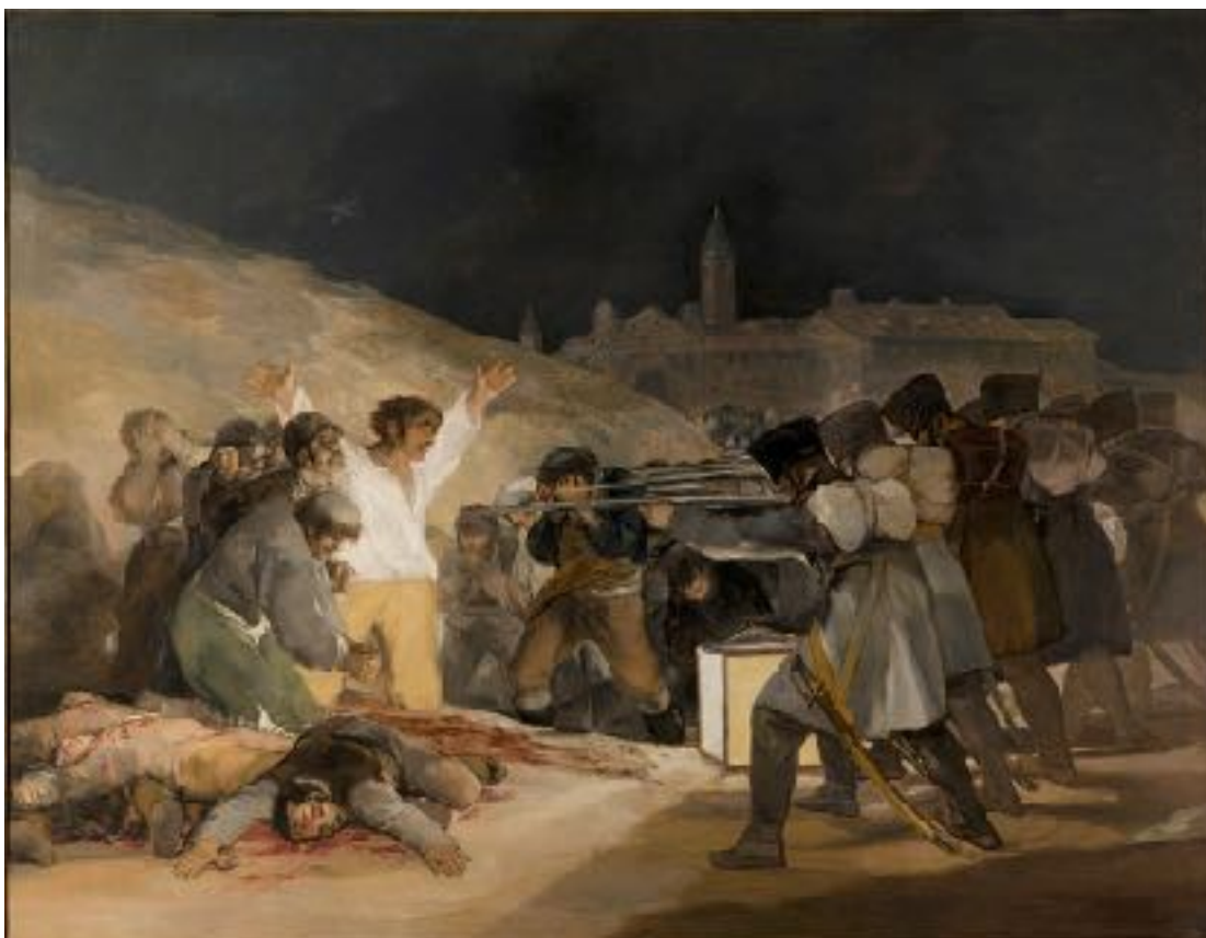
Los fusilamientos de la Moncloa o El tres de Mayo , Goya, 1814, Museo del Prado, Madrid