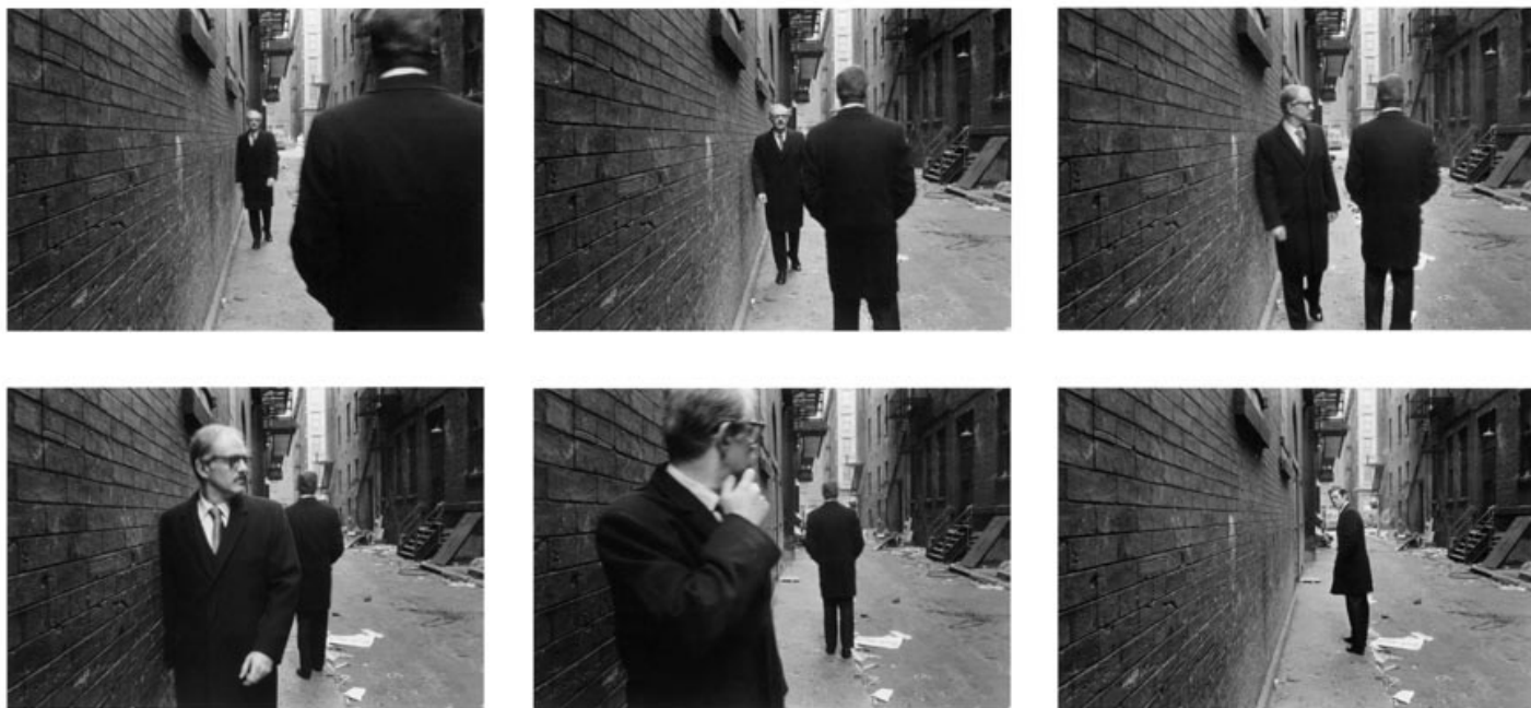
Duane MICHALS, Chance Meeting , 1970, 6 tirages gélatino-argentiques (photographie), 12,7x17,8 cm.