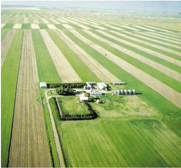
Une exploitation agricole dans les Grandes Plaines.

Complète le texte ci-dessus en choisissant parmi les mots suivants ceux qui sont justes : exportée - vivrière - productiviste - traditionnelle - mécanisée - faibles - forts - commerciale