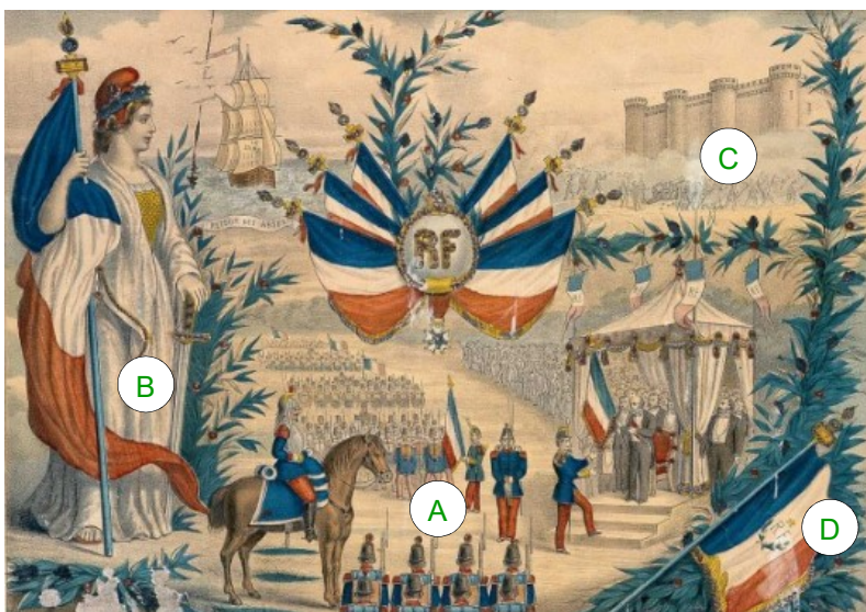
La République triomphante préside la grande fête nationale du 14 juillet 1880, gravure anonyme, 1880.