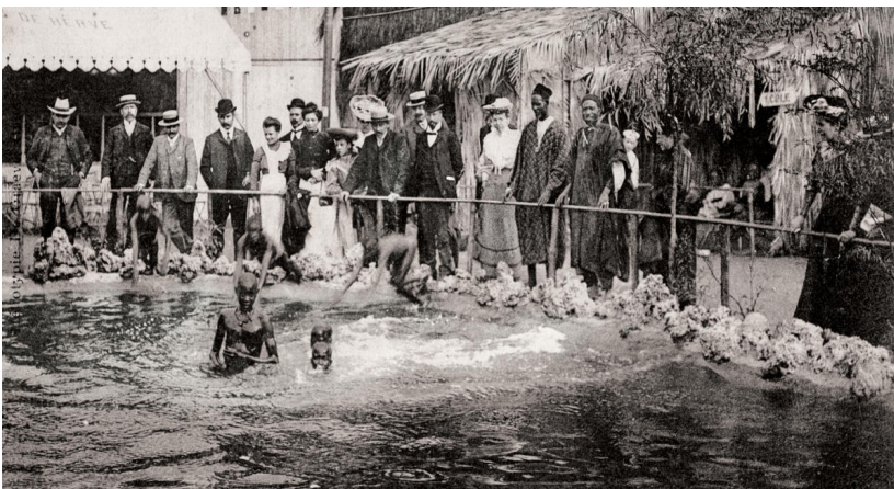
Le bassin du «village sénégalais», Exposition universelle de Liège, carte postale, 1905.

5. Comment se manifeste le fossé qui sépare les colons des colonisés sur la photographie 3 p.119 ? Les colons et les colonisés vivent séparés dans des quartiers différents. Il y a une ségrégation spatiale.