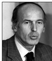
Valéry Giscard d'Estaing (1974-1981)

7. D'après le schéma des institutions p.172-173, quel changement à la Constitution est apporté en 1974 ? En 1974, la majorité passe de 21 à 18 ans.