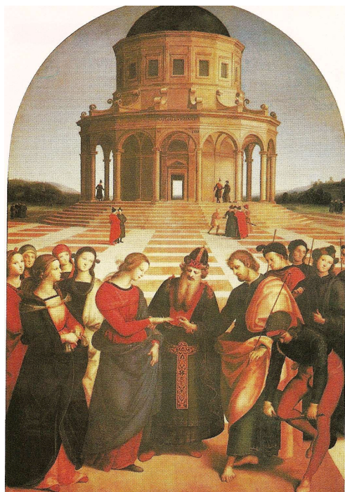
← Le mariage de la Vierge , Raphaël, huile sur toile, 1504.